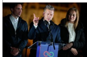
Мадяр: Угорщина буде надійним партнером ЄС і НАТО 13 квітня 2026, 08:37