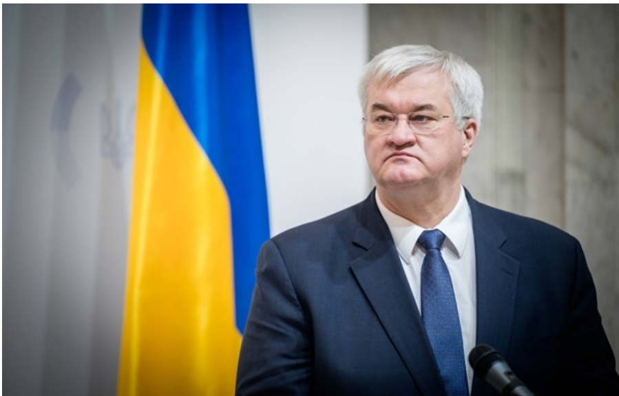
Сибіга сподівається на контакт між Зеленським і Мадяром

Угорській стороні вже передали сигнали щодо можливих контактів на рівні президента України Володимира Зеленського та лідера партії Тиса Петера Мадяра.