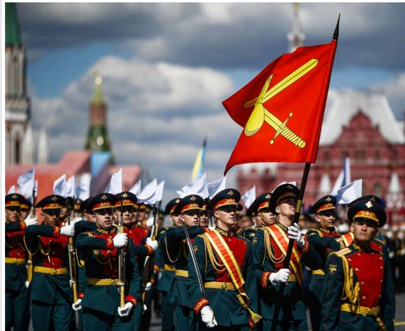
Вперше в історії: Кремль раптово відкликав акредитації іноземних журналістів на парад

Російська влада заборонила іноземним журналістам висвітлювати парад 9 травня в Москві, відкликавши акредитації західних ЗМІ, видані раніше.