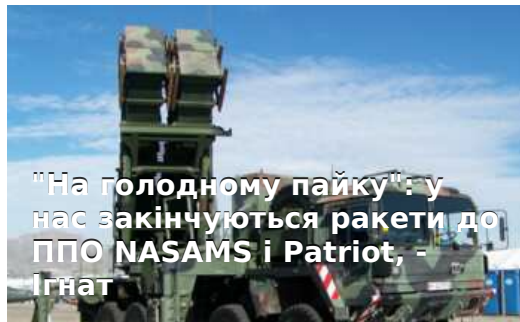
"На голодному пайку": у нас закінчуються ракети до ППО NASAMS і Patriot, - Ігнат