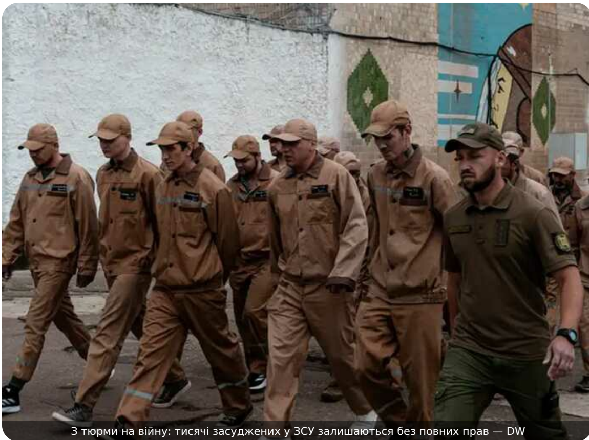
З тюрми на війну: тисячі засуджених у ЗСУ залишаються без повних прав — DW

Понад 12 тисяч злочинців вийшли з-за ґрат за останні два роки, щоб долучитись до ЗСУ.