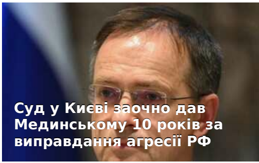
Суд у Києві заочно дав Мединському 10 років за виправдання агресії РФ