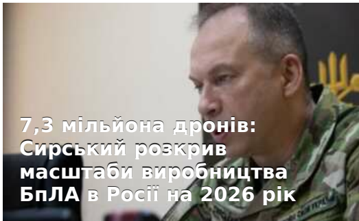
7,3 мільйона дронів: Сирський розкрив масштаби виробництва БПЛА в Росії на 2026 рік