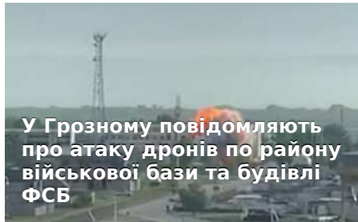
У Грозному повідомляють про атаку дронів по району військової бази та будівлі ФСБ