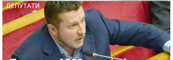
Нардеп Ігор Негулевський перед підозрою у справі "конвертів" оселився в люксовому маєтку в Козині