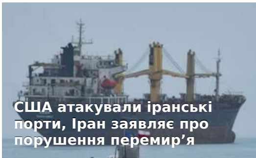
США атакували іранські порти, Іран заявляє про порушення перемир'я