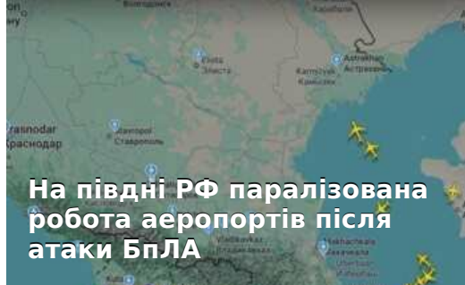
На півдні РФ паралізована робота аеропортів після атаки БПЛА