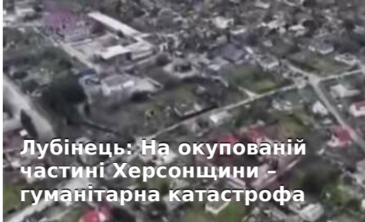
Лубінець: На окупованій частині Херсонщини - гуманітарна катастрофа