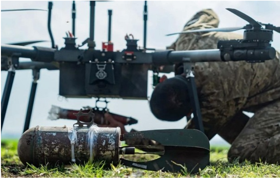
Дрони допомагають стримувати навалу рашистів

Більше половини атак рашистів зосереджено біля Костянтинівки і Покровська. Зараз бої тривають у семи локаціях.