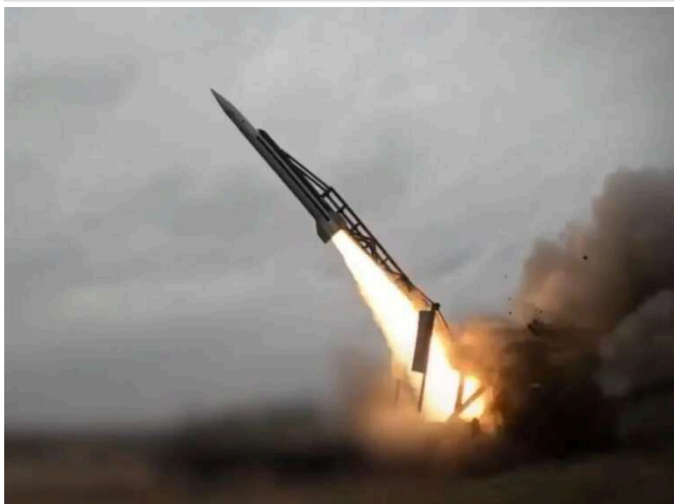
Український «гіперзвук» та удари на 500 км: Веніславський розкрив деталі бойових пусків балістичних ракет

Розкриття неоголошених раніше успіхів українського ракетобудування та планів щодо створення суверенного супутникового угруповання, яке здійснив перед підкомітетом з державної безпеки, оборони та оборонних інновацій Комітету Верховної Ради з питань національної безпеки, оборони та розвідки Федір Веніславський, цілком варто сприймати не лише у ключі космічної програми.