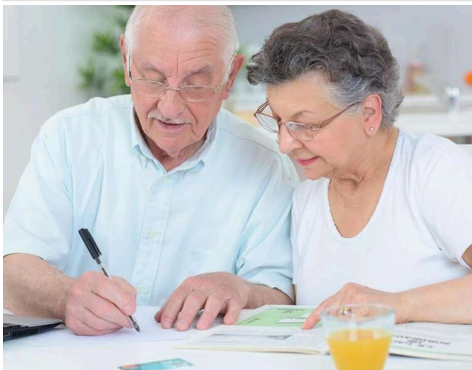
Пенсії за реальними цінами: у Раді пропонують прив'язати виплати до «фактичного» прожиткового мінімуму

В Україні планують змінити метод визначення мінімальних пенсій та соціальних виплат. З цією метою до Верховної Ради внесено законопроект № 15166, який передбачає зміни до Закону України «Про прожитковий мінімум». Документ пропонує запровадити «фактичний прожитковий мінімум» для розрахунку розмірів мінімальної пенсії, соціальних виплат і державної допомоги.