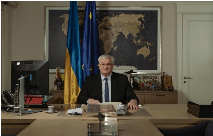
Попереду в Україні та Угорщини багато роботи для того, щоб відновити відносини добросусідства, зазначив Сибіґа

Україна готова до нормалізації відносин з Угорщиною, додав міністр закордонних справ Андрій Сибіґа.