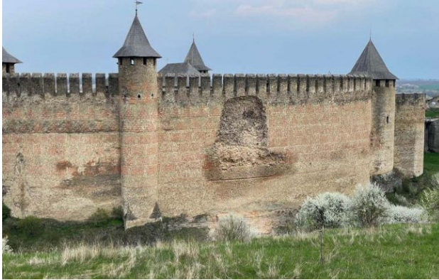
Фото: стан муру Хотинської фортеці після обвалу

В Хотинській фортеці в Чернівецькій області (Буковина) стався частковий обвал на одному з мурів. Постраждалих немає, доступ туристів до аварійної ділянки обмежили.