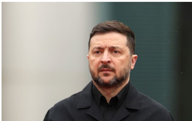
Фото: президент України Володимир Зеленський (Getty Images)

Українські санкції та удари скорочують нафтовий експорт Росії - президент України Володимир Зеленський назвав конкретні цифри по трьох ключових портах.