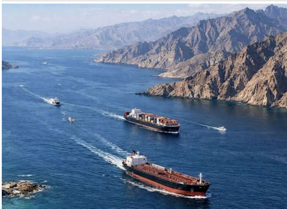
«Насолоджуйтесь поточними цінами»: Іран пригрозив США бензином понад 5 доларів через блокаду протоки

Іран попередив американців про різке підвищення цін на бензин у відповідь на заяву Трампа щодо блокування Ормузької протоки.