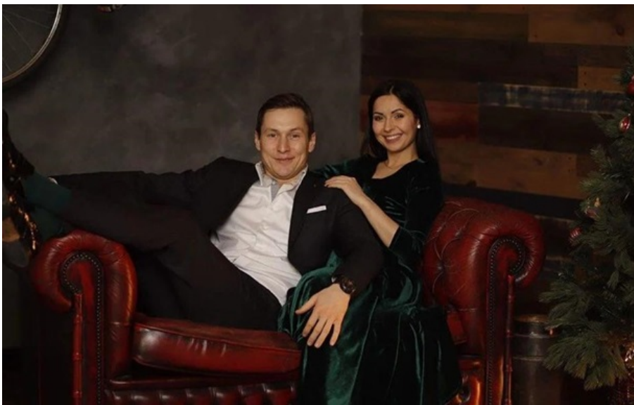
Подружжя Октябрських

Артист поділився подробицями особистого життя у відвертому інтерв'ю, зізнавшись, що ініціаторкою розставання стала його ексобраниця.