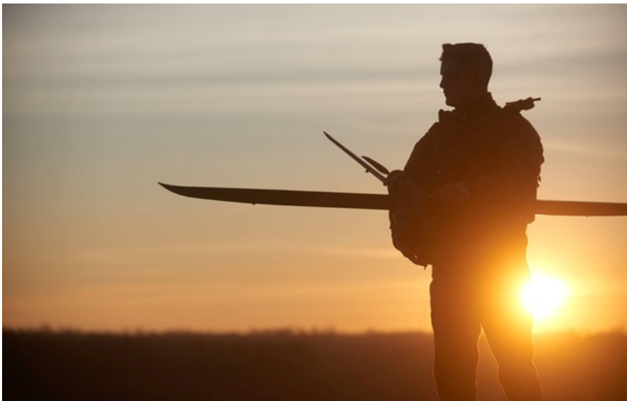
На Гуляйпільському напрямку відбулося 12 атак окупантів