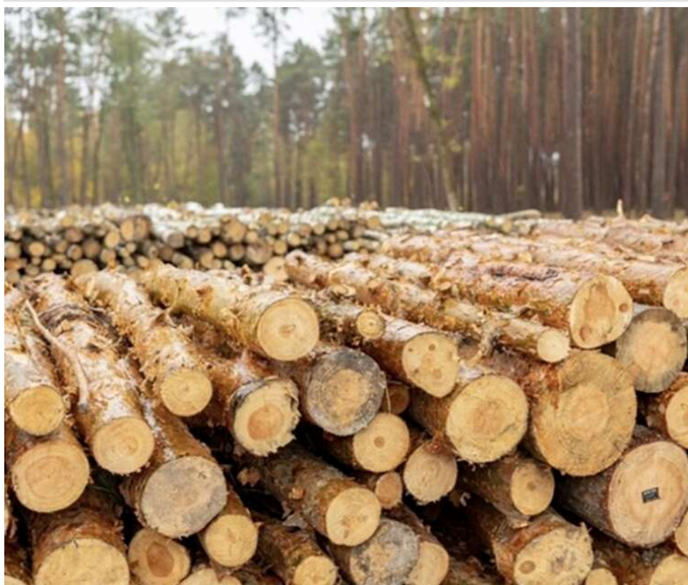
Спроба незаконного експорту лісу: київського бізнесмена оштрафували на 350 тисяч гривень за фіктивні накладні

Використав фіктивні документи для експорту деревини: суд оштрафував київського підприємця на 350 тисяч гривень.