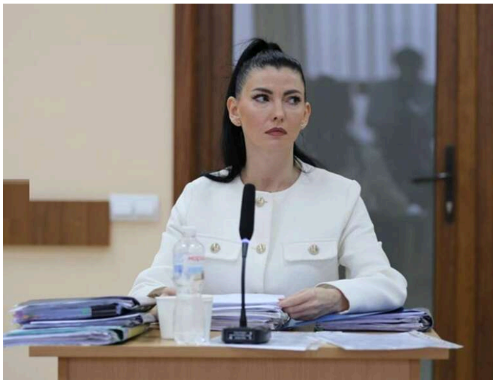
Мільйонерка на паузі: як суддя без повноважень Шаховніна продовжує отримувати величезні виплати з бюджету