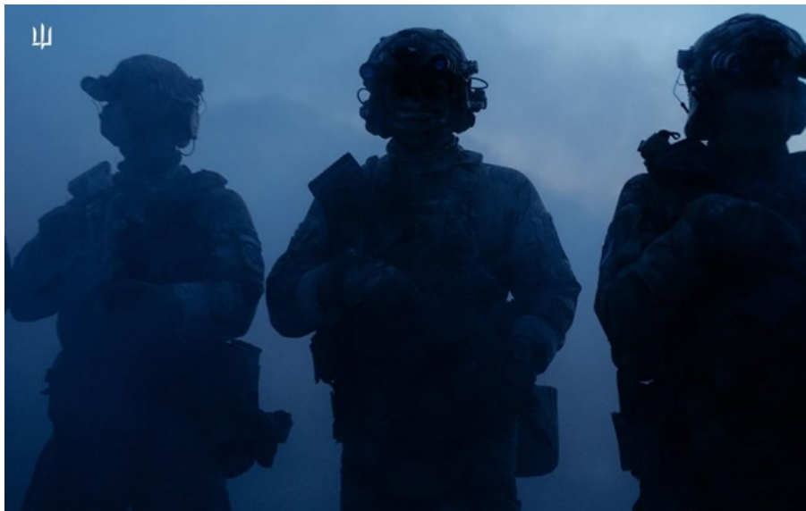
Бійці ГУР завдали рекордних втрат кадірівцям

Були задіяні бійці спецпідрозділу Шаманбат разом зі 104 бригадою ТрО Горинь у взаємодії з підрозділом агентурних операцій ГУР.