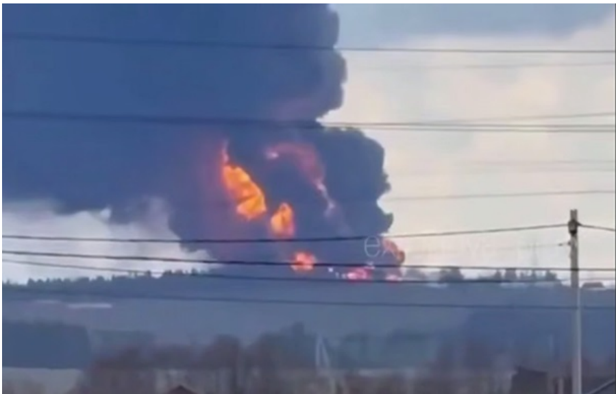
Пожежа на станції нафтопроводу Перм

Українські дрони вдарили, зокрема, по нафтоперекачувальній станції поблизу Пермі. На підприємстві вирує масштабна пожежа.