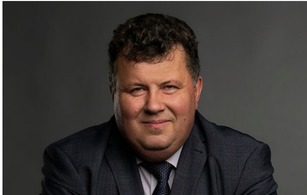
Фото: Володимира Бугрова звільнили з посади ректора (facebook.com/VolodymyrBugrov)

Володимира Бугрова звільнили з посади ректора Київського національного університету імені Тараса Шевченка. Вибори нового керівника вишу призначені на 27 травня 2026 року.