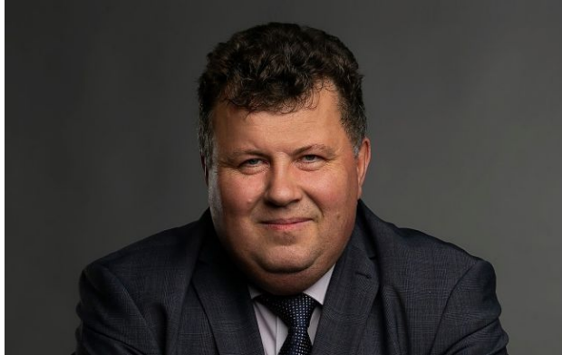
Фото: Володимира Бугрова звільнили з посади ректора (facebook.com/VolodymyrBugrov)

Володимира Бугрова звільнили з посади ректора Київського національного університету імені Тараса Шевченка. Вибори нового керівника вишу призначені на 27 травня 2026 року.