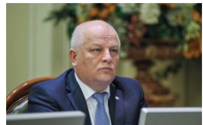
Помер народний депутат Степан Кубів