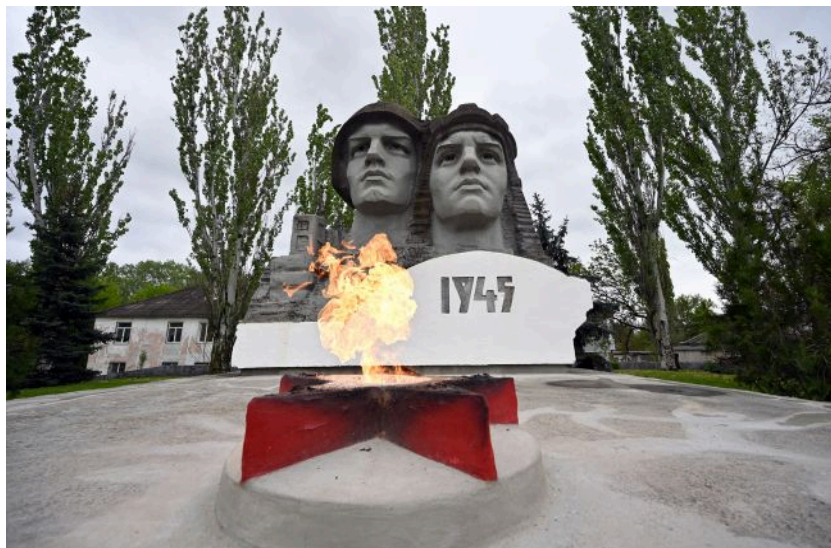
8 травня - День пам'яті та перемоги над нацизмом у Другій світовій війні