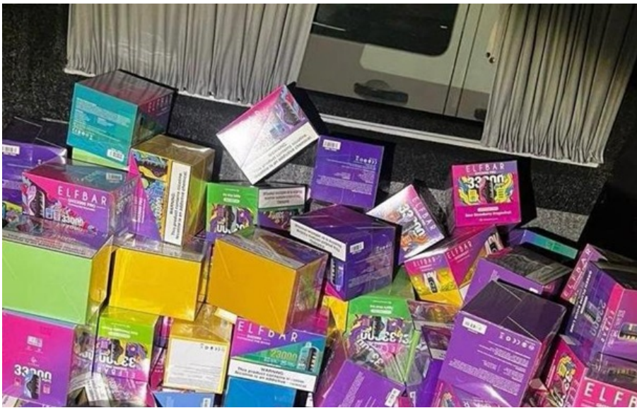
Митники завадили незаконному ввезенню в Україну електронних сигарет

Під час огляду у підлозі авто митники виявили нішу. У ній було заховано 268 упаковок одноразових електронних сигарет Elf Bar.