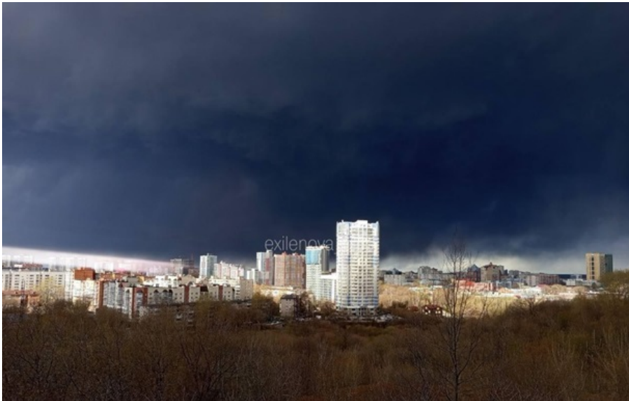
Дим від пожежі над містом Перм

На нафтоперекачувальній станції виникла масштабна пожежа. За попередньою інформацією, горять майже всі резервуари для зберігання нафти.