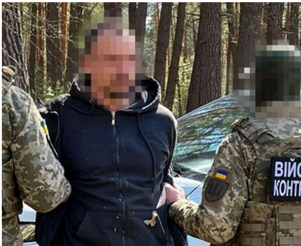
СБУ викрила «крота» у Держприкордонслужбі, який допомагав РФ обходити українську ППО на півночі

У Службі безпеки України оголосили про затримання «крота» з Головного розвідувального управління РФ. Він планував для агресора шляхи для авіаударів по Києву та Чернігівщині. Виявилось, що арештований – інспектор Державної прикордонної служби.