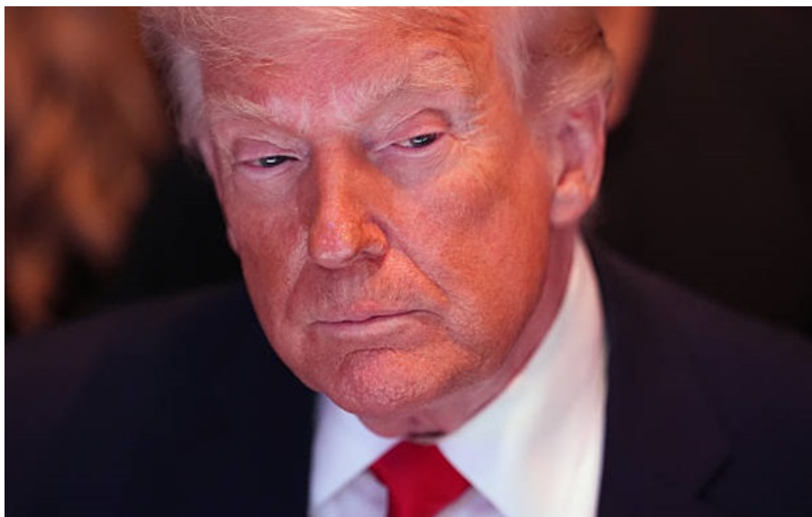
Президент США Дональд Трамп

"Червоні лінії" лідера США стосуються не тільки відкриття Ормузької протоки та збагачення урану Тегераном.