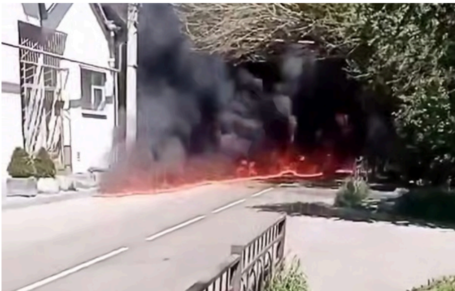
Жителі російського міста заявили про "екологічну катастрофу"