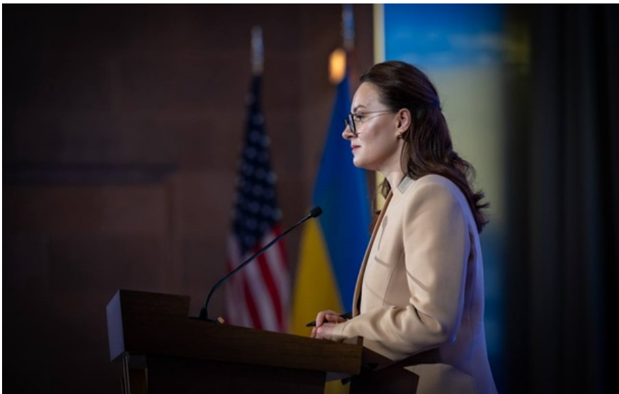
Прем'єр-міністр України Юлія Свириденко

Україні вдалось домовитись з Міжнародним валютним фондом щодо непопулярного підвищення податків.