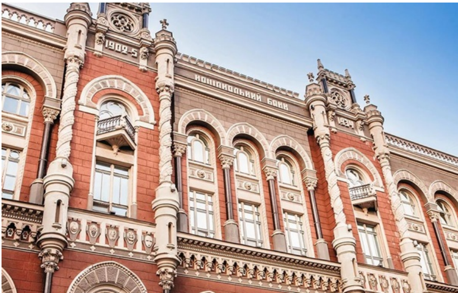
Нацбанк опустив курс гривні на вівторок

На міжбанку американська валюта зросла на 6 копійок і тепер перебуває на рівні 44,08-44,11 грн/долар купівля-продаж.