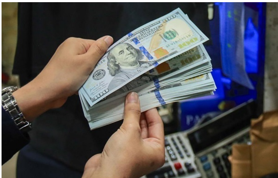
Обмінники купують долар у середньому по 43,80 гривні

Середній курс продажу долара залишився на рівні 43,90 гривні, а курс продажу євро зріс до 51,80 гривень.