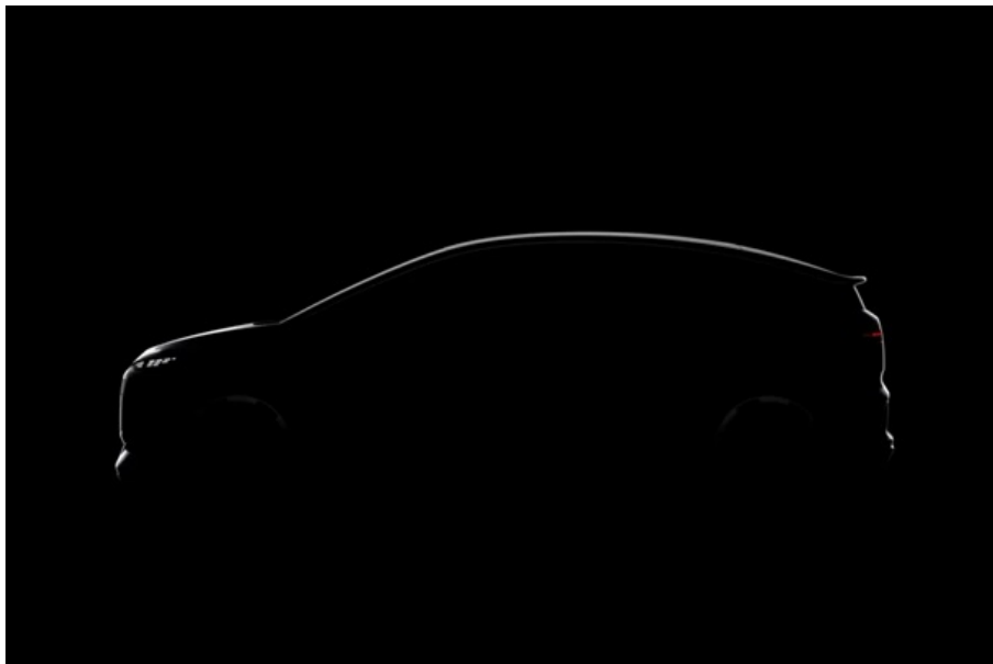
Єдине фото майбутнього Audi A2 e-tron

електрифікованих рішеннях. Одним із таких стане новий хетчбек Audi A2 e-tron, який отримає відроджений індекс A2.