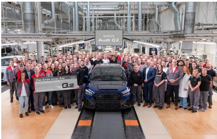
У обох автомобілів не планується наступників

Німецький бренд скорочує лінійку компактних моделей і робить ставку на електрифікацію.