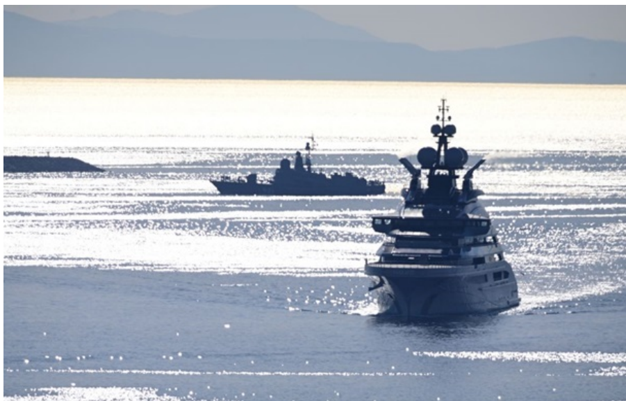
Яхта Nord Олексія Мордашова

Власник яхти - Олексій Мордашов, - цього тижня з великим відривом очолив список найбагатших росіян за версією Forbes.