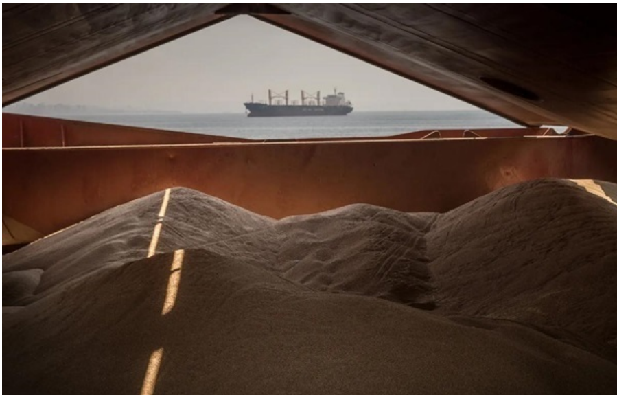
Фото: TRT Haber (ілюстративне фото) Ізраїль вкотре прийняв судно із вкраденим у України зерном

У Єрусалимі заявили, що не отримали доказів того, що прийняте судно перевозило вкрадене Росією українське зерно.