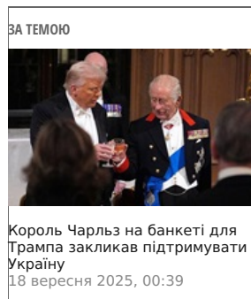
Король Чарльз на банкеті для Трампа закликав підтримувати Україну 18 вересня 2025, 00:39

Монарх звернувся і до теми війни в Україні, проводячи паралелі з трагічними подіями 11 вересня 2001 року, коли НАТО вперше ввело в дію статтю 5 про колективну оборону. Він закликав міжнародну спільноту