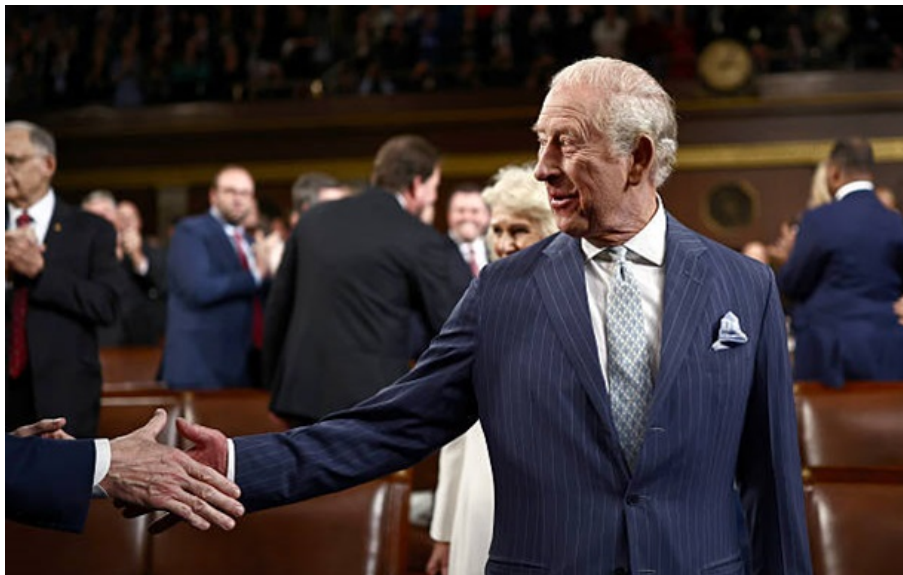
Король Британії Чарльз III

У контексті України світ потребує такої ж єдності, як продемонстрував 11 вересня 2001 року, коли НАТО вперше застосувало статтю 5 про колективну оборону, вважає Чарльз III.