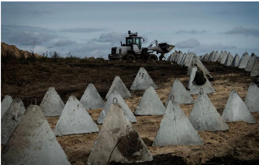
Будуються лінії невибухових загороджень глибиною до 120-150 метрів

Україна змушена активно нарощувати оборону, бо росіяни навчилися швидко формувати угруповання та перекидати сили.