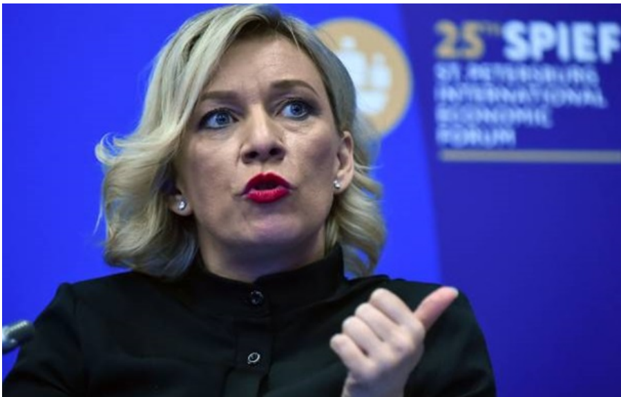
Офіційна представниця МЗС РФ Марія Захарова

На думку Москви, необхідно "врахувати геополітичні реалії" та відновити баланс безпеки в Європі.