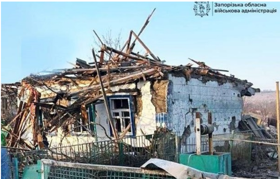
Наслідки чергової атаки РФ

Загалом троє осіб зазнали поранень внаслідок ворожих атак по Запоріжжю та Запорізькому району.