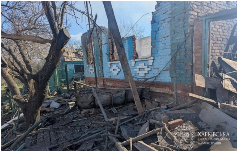
Наслідки російських ударів

Ворог протягом доби атакував Основ'янський, Слобідський, Немишлянський райони Харкова.