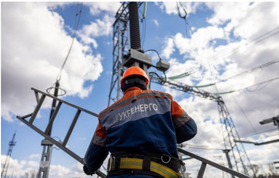
В енергетику додалося роботи після нових атак рашистів

Наразі енергетики роблять усе можливе, щоб якнайшвидше повернути пошкоджене обладнання в роботу.