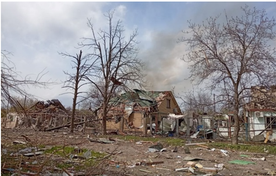
Наслідки обстрілу на Донеччині

Загалом за минулу добу російські війська 19 раз обстріляли населені пункти Донеччини. Відомо про двох загиблих.