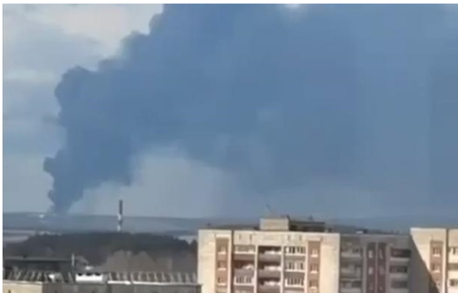
Ранкова пожежа в Пермському краї

Вже час переходити до дипломатії, і цей сигнал варто почути Москві, наголосив глава держави.