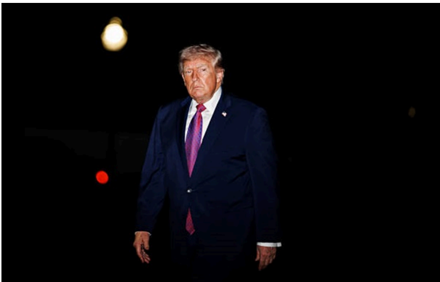
Президент США Дональд Трамп

Президента США евакуювали з вечері кореспондентів Білого дому після гучних звуків. Стрільця затримали.