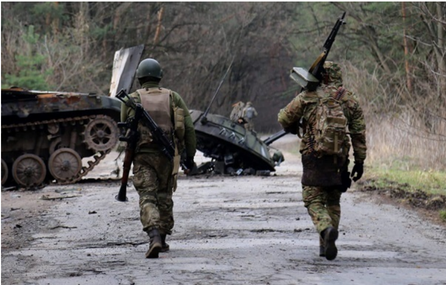
Ворог окупував Мирне

На мапі DeepState станом на 12 квітня село Мирне Запорізької області позначене як окуповане.