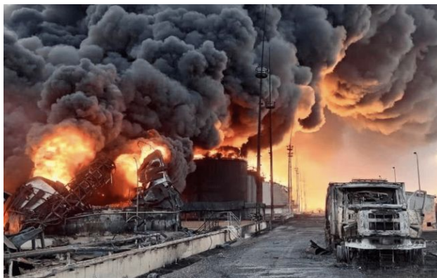
Фото: дрони СБУ уразили стратегічний нафтовий хаб біля Пермі (росЗМІ)

Служба безпеки України уразила стратегічну нафтоперекачувальну станцію біля російського міста Перм за понад 1500 кілометрів від України.