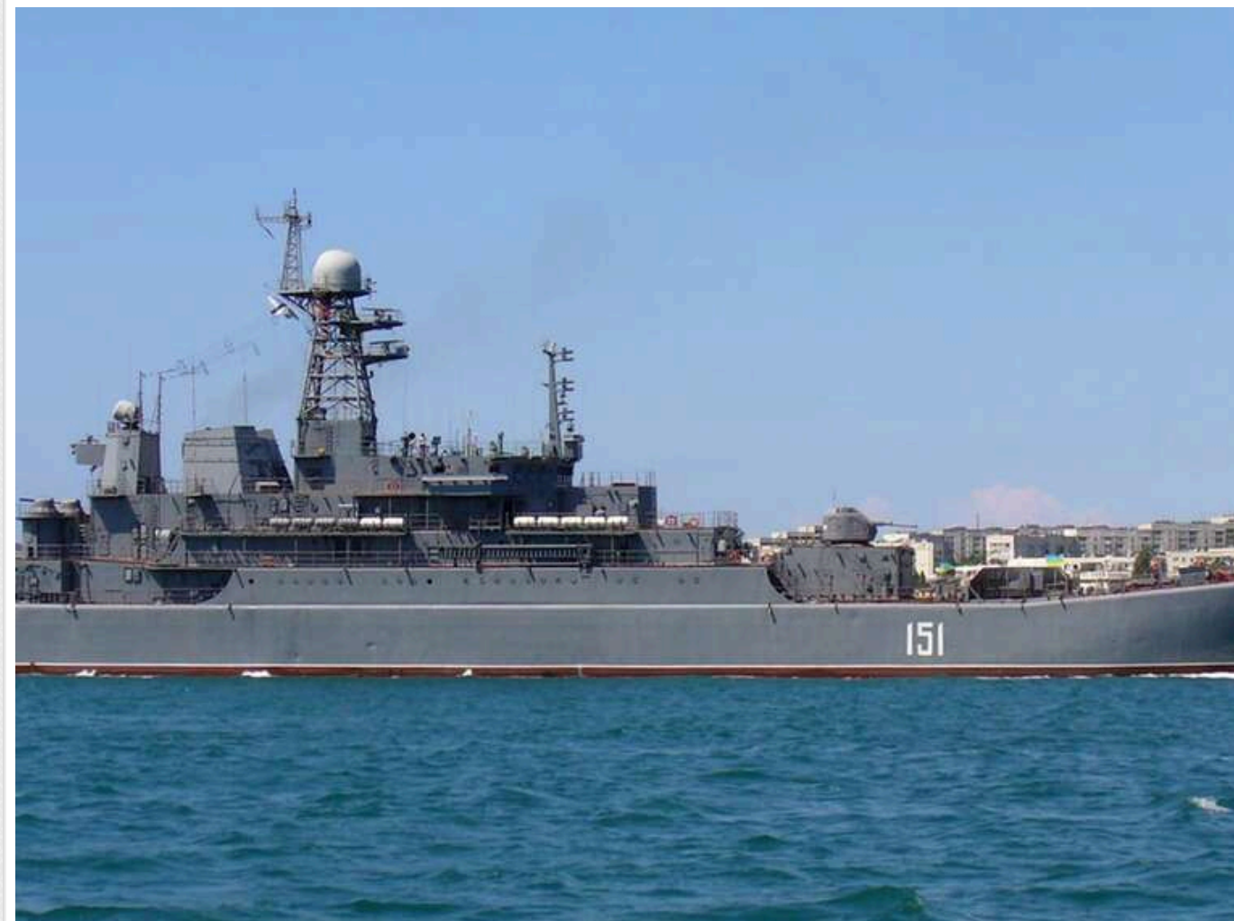
СБУ заявляє про ураження трьох кораблів РФ в окупованому Севастополі

СБУ повідомляє про пошкодження трьох російських кораблів у Криму: двох великих десантних кораблів «Ямал» і «Азов», а також одного військового судна невідомого типу.