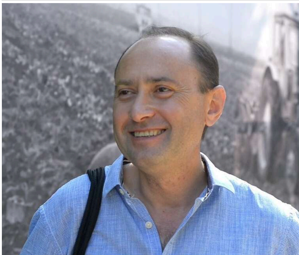
Новий очільник фонду-привида: що задекларував Сергій Германовський, який керує Націнвестфондом у стадії ліквідації

Сергій Германовський очолює Національний фонд інвестицій України, який перебуває на стадії ліквідації (раніше ним керував Тимофій Милованов).