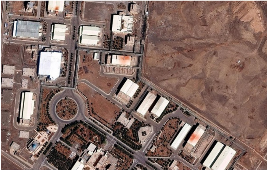
Комплекс ядерного об'єкта Натанз та навколишньої інфраструктури в провінції Ісфахан

Міжнародне агентство з атомної енергії фактично втратило фізичний доступ до об'єктів, визнав його гендиректор Рафаель Гроссі.