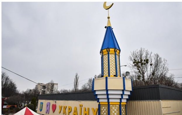
Фото: що відомо про нічний напад на ісламський центр

У Львові невідомий кинув дві пляшки із запальною сумішшю в Ісламський релігійно-культурний центр.