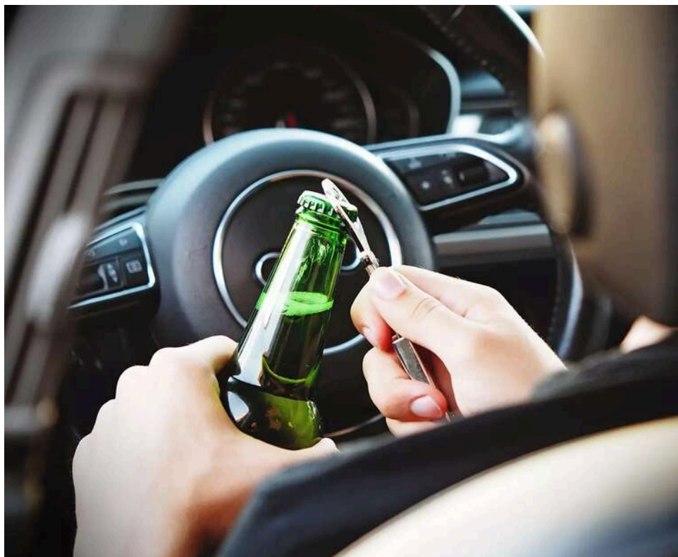
Посвідчення не допомогло: харківського прокурора Орлова покарали за спробу уникнути перевірки на сп'яніння

Прокурора Харківської обласної прокуратури Ігоря Орлова покарали за відмову від огляду на сп'яніння та використання службового посвідчення