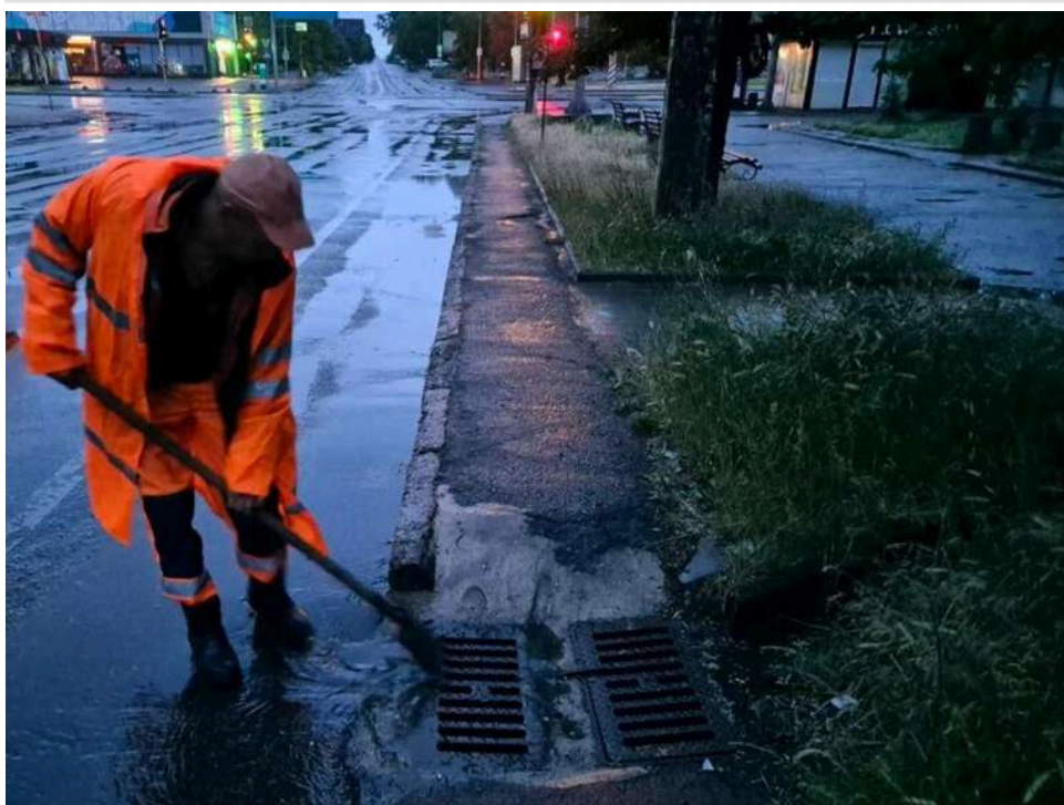
Сантехніки на Lexus та двірники з Tesla: як одеські мажори та бізнесмени ховалися від мобілізації в ЖЕКах