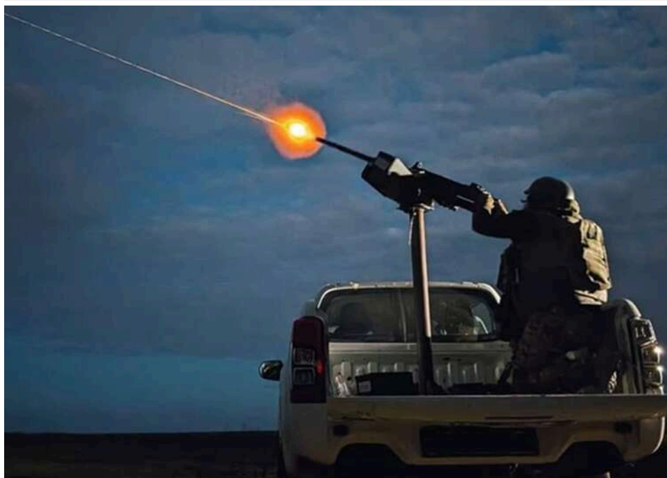
Нічна атака РФ: Сили оборони знищили 154 ворожі цілі з 171

У ніч проти 29 квітня Росія здійснила чергову повітряну атаку на Україну: ворог застосував 171 засіб повітряного нападу. Сили ППО знищили 154 цілі.