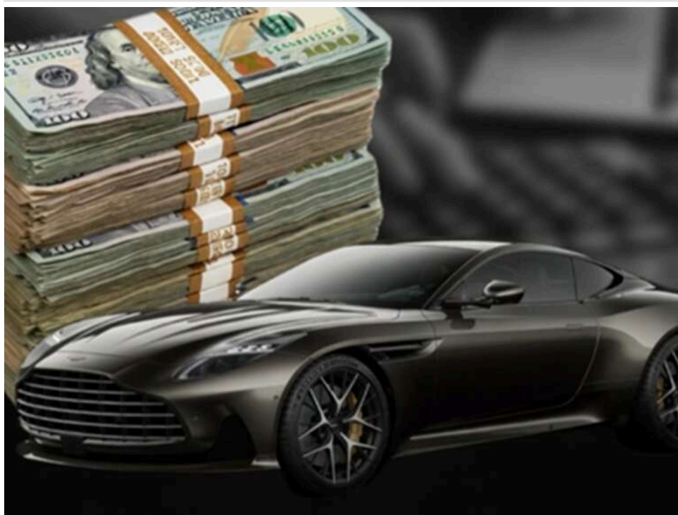
Махінації на 12 мільйонів: у Держфінмоніторингу викрили псевдоблагодійний фонд, що наживався на ЗСУ

Державна служба фінансового моніторингу разом із правоохоронними органами виявила шахрайську схему, організовану однією з благодійних організацій, зареєстрованих в Україні.